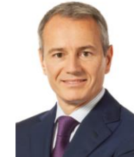
Gian-Luca Lardi Präsident Schweizerischer Baumeisterverband