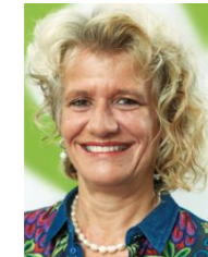
Katharina Prelicz-Huber Mitglied Nationalrat GRÜNE Präsidentin Gewerkschaft VPOD (Verband Personal öffentlicher Dienste)