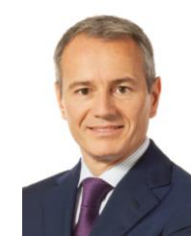
Gian-Luca Lardi Präsident Schweizerischer Baumeisterverband